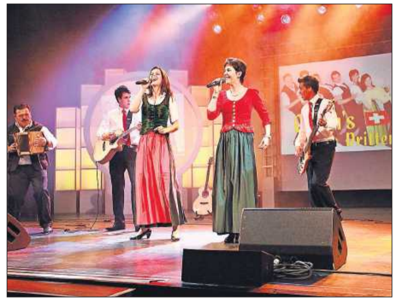
Herzig: Die Sängerinnen von „Oesch's die Dritten“ jodeln kräftig.