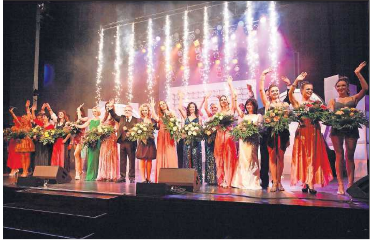
Farbenprächtig: Nach fünfeinhalbstündiger Show werden die Akteure des Abends gefeiert.