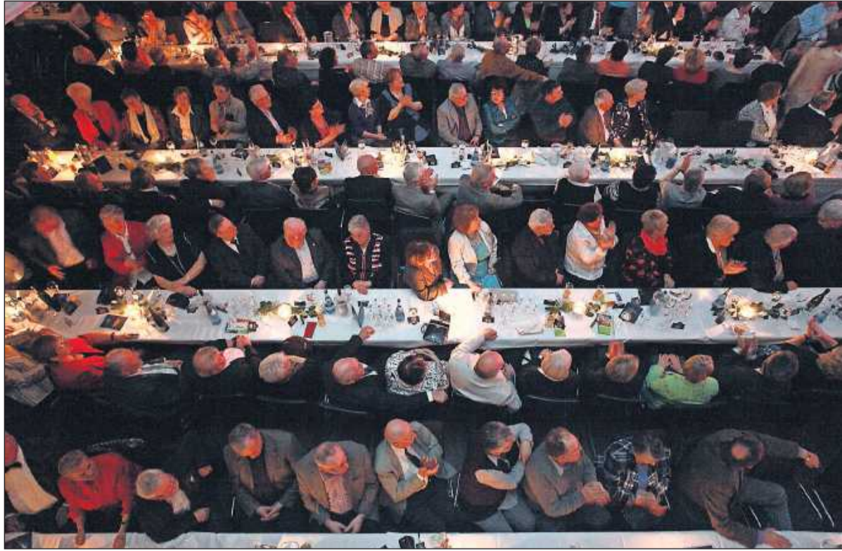
Ausverkauft: Bei der Hans-Rosenthal-Gala in der Landauer Festhalle sind alle Plätze belegt.