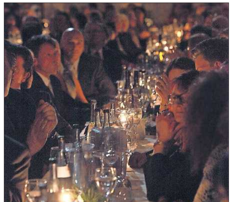
Festlich: Die Gäste genießen die Gala bei Wein und Show.